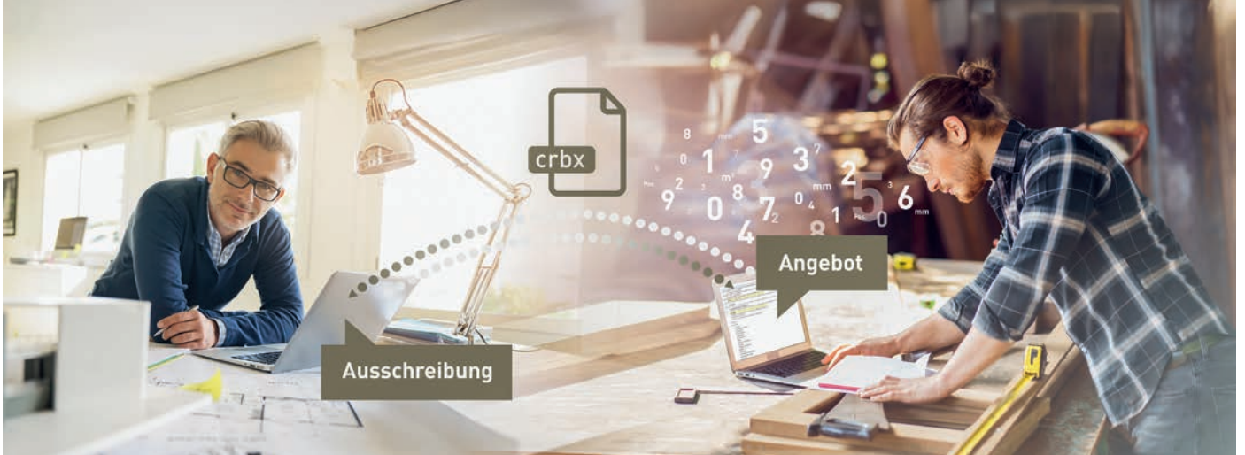
Die Webapplikation vereinfacht den digitalen Datenaustausch zwischen Planenden und Ausführenden.

Digitalisierung Effizienter offerieren: Mit dem NPK-Editor von CRB bearbeiten Sie Leistungsverzeichnisse digital – zeitsparend, einfach und ohne Fehler.