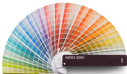
Immagine con legenda:

«NCS Index 2050 Original» offre una panoramica compatta di tutti i 2050 colori standard NCS.