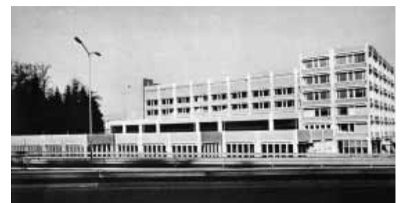
Zentralmagazingebäude der Swissair in Kloten, Arch. Peter Steiger, 1965–67: Gesamtansicht von Süden, Fassadenstützen von 25 m während der Montage.