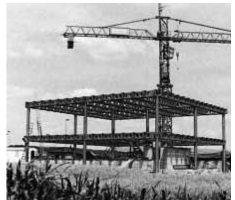
System Midi, Arch. Fritz Haller: Stanzen, Verformen, Montage, Oberflächenveredelung und Montage auf der Baustelle. Bilder aus: Franz Füeg, Industrielles Bauen, Schweizer Baudokumentation 1977